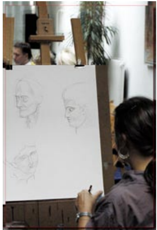
Elève travaillant sur une étape du portrait

Nous pensons qu'en développant le potentiel créatif propre à chaque individu, nous participons à son épanouissement personnel. Ceci se manifestera tantôt de manière ludique, tantôt de manière réflexive aboutissant à des prises de conscience ouvrant sur de nouveaux horizons souvent insoupçonnés.