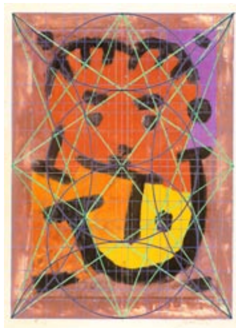
Travail d'analyse de la composition d'après une peinture de Paul Klee «Le Musicien», 1937

La formation consiste en des études plus approfondies, plus précises et plus abouties demandant de la part de l'étudiant un engagement certain. Il s'agira d'acquérir les compétences enseignées pour en faire un domaine où l'étudiant saura se développer de manière indépendante et autonome.