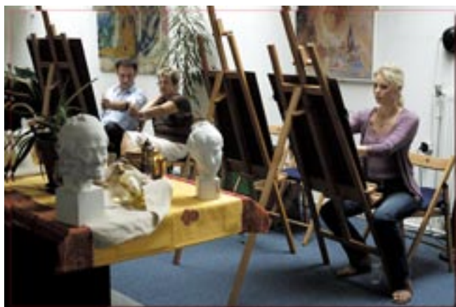
Situation lors d'un cours à l'atelier de l'Artquarium

Un autre volet sera parallèlement dédié au monde vaste et riche de la couleur et de son évolution dans l'histoire de l'art. L'élève pourra apprivoiser des concepts de tonalité, de température,