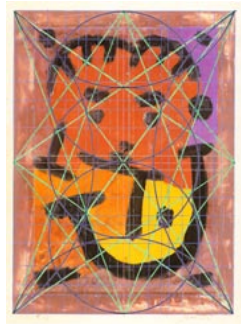
Travail d'analyse de la composition d'après une peinture de Paul Klee «Le Musicien», 1937

La formation consiste en des études plus approfondies, plus précises et plus abouties demandant de la part de l'étudiant un engagement certain. Il s'agira d'acquérir les compétences enseignées pour en faire un domaine où l'étudiant saura se développer de manière indépendante et autonome.